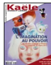
Kaële Magazine n° 95 Décembre 2012

É.W. : Évaluer la diversité des fonctionnements des couples. Nous sommes partis de l'hypothèse qu'il existait une diversité des modèles de couples, en partant de variables sociologiques et non psychologiques. Les différentes dimensions du couple ont été analysées avec des critères tels que la division du travail domestique, le relationnel entre les conjoints, l'ouverture du couple